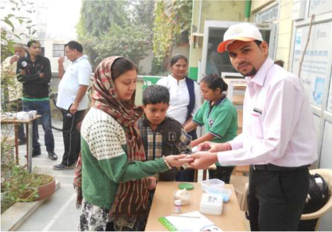
हिमालया ड्रग कम्पनी की ओर से स्वास्थ्य मंदिर रणजीत नगर पर निःशुल्क डायबिटीज एवं मोटापा जाँच शिविर का उद्घाटन