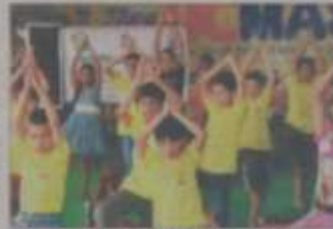
योग शिविर में लोग योग कर रहे हैं।

स्वास्थ्य मंदिर संस्थान की ओर से आयोजित योग शिविर का शुभारंभ हुआ। शिविर में 15 दिनों तक योग व्यायाम होगा। शिविर में 15 दिनों तक योग व्यायाम होगा। शिविर में 15 दिनों तक योग व्यायाम होगा। शिविर में 15 दिनों तक योग व्यायाम होगा। शिविर में 15 दिनों तक योग व्यायाम होगा।