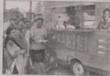
अन्नपूर्णा कैंटीन वैन मुम्बई

भोजनालय में विद्यमान अन्नपूर्णा में इसे अन्नपूर्णा भोजनालय। भोजनालय में विद्यमान अन्नपूर्णा में इसे अन्नपूर्णा भोजनालय। भोजनालय में विद्यमान अन्नपूर्णा में इसे अन्नपूर्णा भोजनालय। भोजनालय में विद्यमान अन्नपूर्णा में इसे अन्नपूर्णा भोजनालय। भोजनालय में विद्यमान अन्नपूर्णा में इसे अन्नपूर्णा भोजनालय। भोजनालय में विद्यमान अन्नपूर्णा में इसे अन्नपूर्णा भोजनालय।