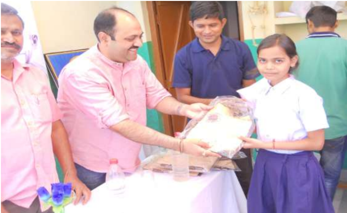
गांधी जयंती दिवस के अवसर पर स्वास्थ्य मंदिर संस्थान द्वारा स्वास्थ्य मंदिर पर प्राकृतिक चिकित्सा दिवसके अवसर पर राजकीय प्राइमरी स्कूल अनाह गेट एवं कुम्हेर गेट हरिजन बस्ती की बालिकाओ को स्कूल ड्रेस प्रदान की