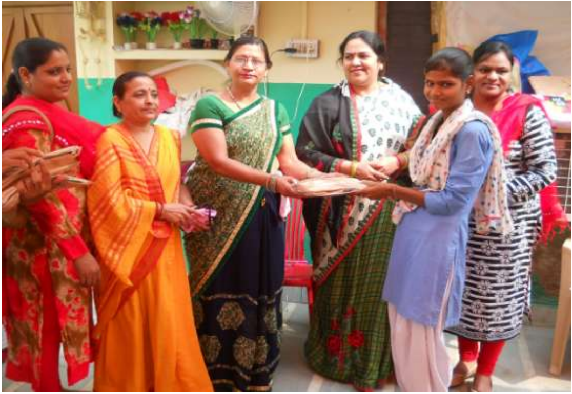
स्वास्थ्य मंदिर पर महिला सेवा ईकाई के द्वारा रेलवे स्कूल की 20 छात्राओ को ड्रेस दी गई